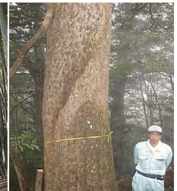
材400年生 目通り 3.2 和歌山県産