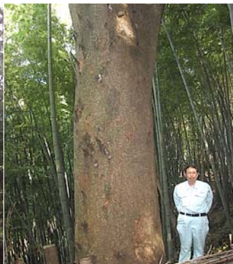
榲200年生 目通り 3.8 奈良県産