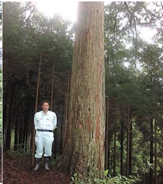
桧200年生 目通り 2.7 三重県産