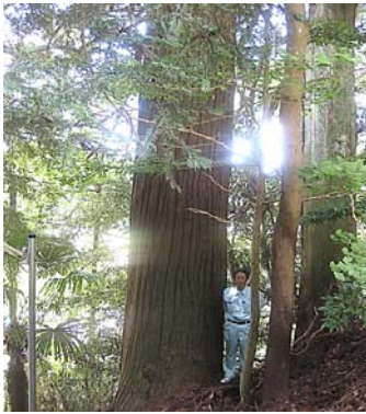
杉300年生 目通り 4.5 奈良県 宇陀市神社林