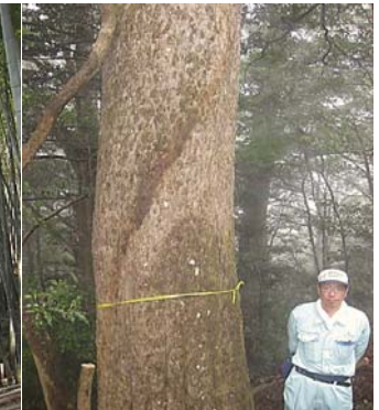
トガ400年生 目通り 3.2