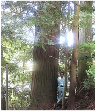
杉300年生 目通り 4.5