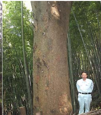
樺200年生 目通り 3.8