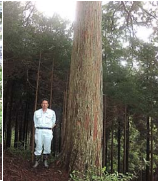
桧200年生 目通り 2.7